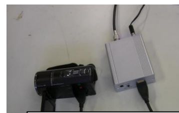
HD カメラと HDMI-SDI 変換器